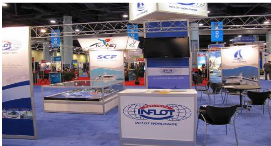
SEATRADE WINTER CRUISING FORUM 2011 г. Стамбул

В октябре 2011 года представители порта Сочи были приглашены в качестве докладчиков на конференцию CRUISE AND TOURISM, проходившую в г.Ираклион (Греция). В рамках конференции были представлены доклады по круизному судоходству в регионе южного и восточного Средиземноморья, а также Черного моря. Кроме того, отмечалась необходимость и важность развития яхтенного туризма в этих регионах.